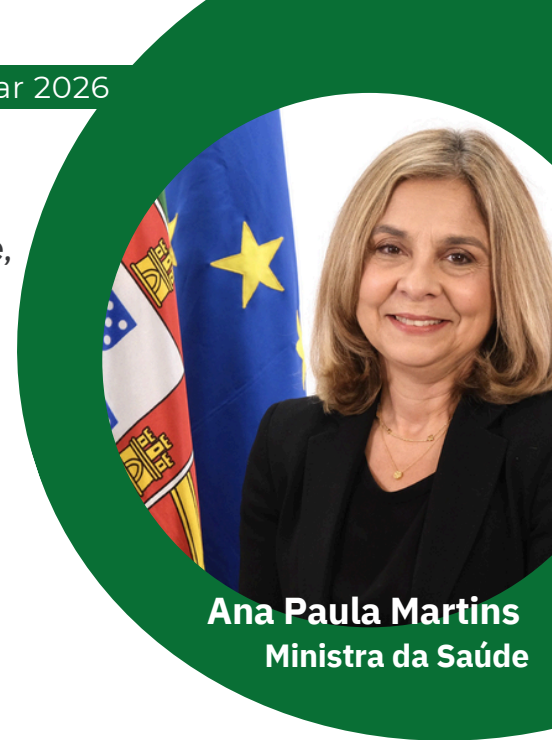
Ana Paula Martins Ministra da Saúde

Recebam, por isso, o meu agradecimento sentido e o reconhecimento institucional pelo vosso exemplo de serviço público.